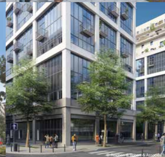
© Reichen et Robert & Associés