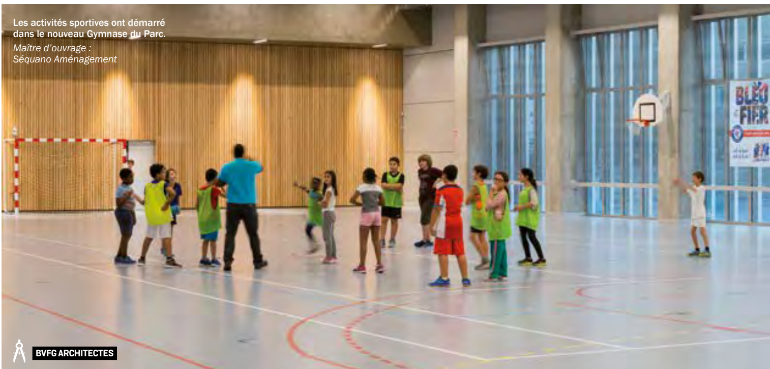
Les activités sportives ont démarré dans le nouveau Gymnase du Parc. Maître d'ouvrage : Séquano Aménagement