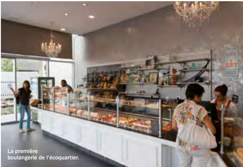
La première boulangerie de l'écoquartier.