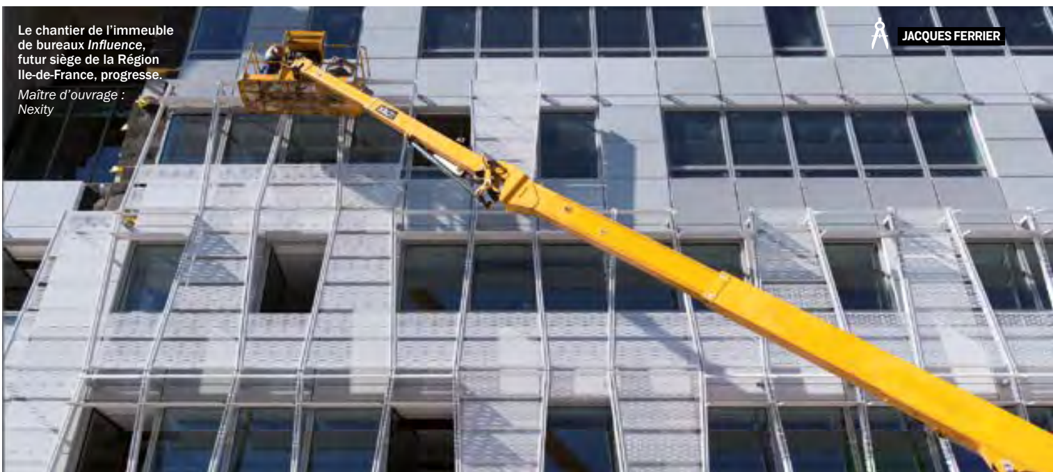
Le chantier de l'immeuble de bureaux Influence , futur siège de la Région Ile-de-France, progresse. Maître d'ouvrage : Nexity