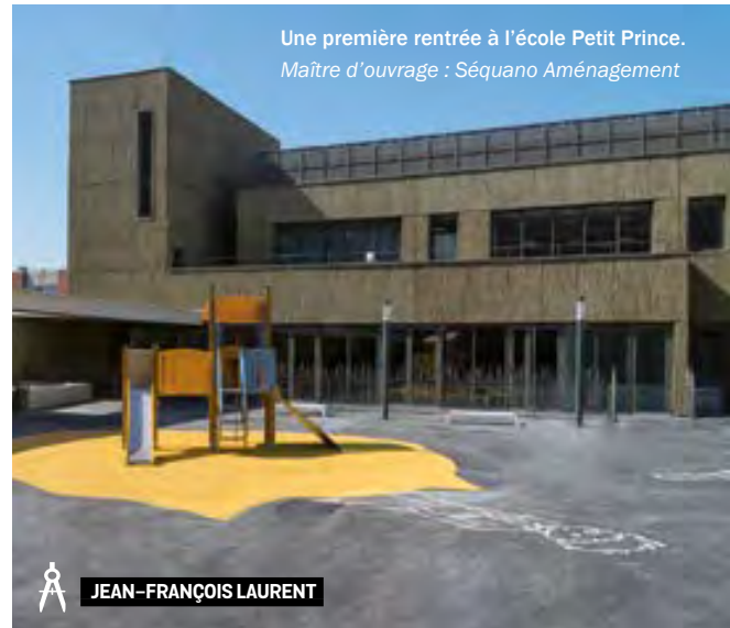
Une première rentrée à l'école Petit Prince. Maître d'ouvrage : Séquano Aménagement