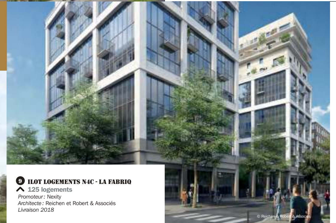
© Reichen & Robert & Associés

4 ILOT LOGEMENTS N4C - LA FABRIQ ▲ 125 logements Promoteur : Nexity Architecte : Reichen et Robert & Associés Livraison 2018