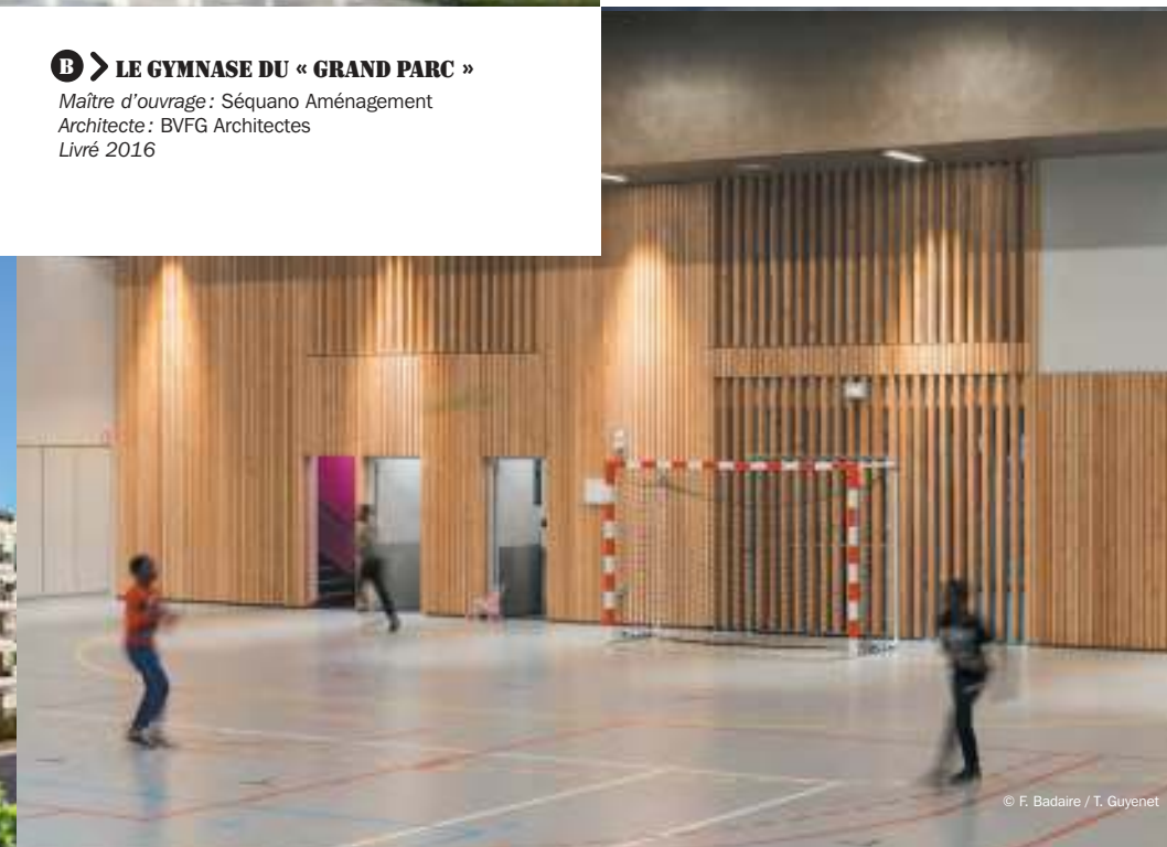
© F. Badaire / T. Guyenet